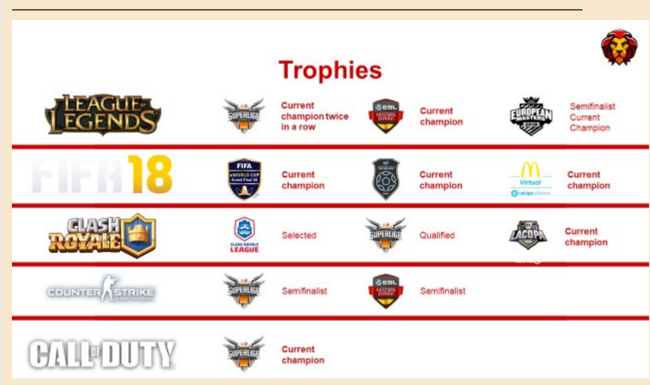
Tabla 1. Resultados de los diferentes equipos de MAD Lions E.C. durante la temporada 2018

Tabla elaborada a partir de MAD Lions E.C., 2019.